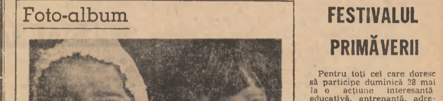
Treptele mirării