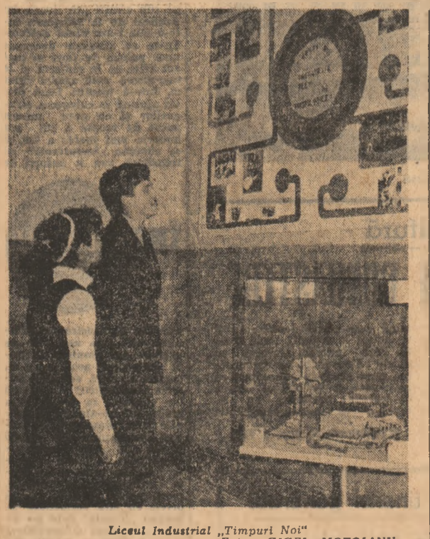
Liceul Industrial „Timpuri Noi”