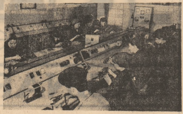
Modernul atelier de electrotehnică al Liceului „Al. I. Cuza” din Pitești în timpul desfășurării activităților practice.