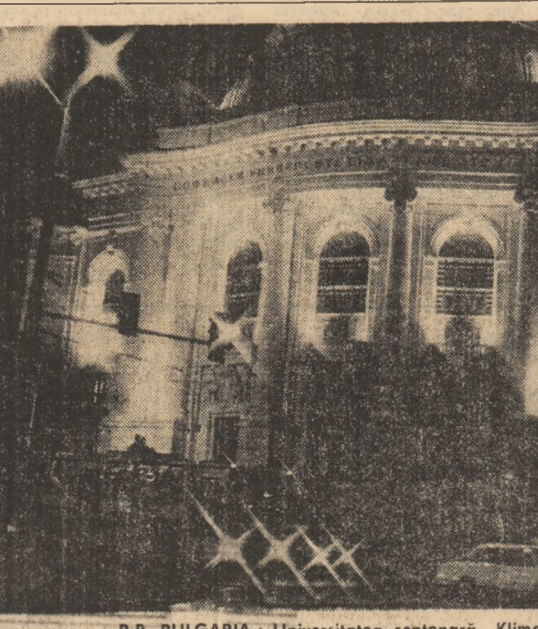
R.P. BULGARIA: Universitatea centenară „Kliment Ohridski” din Sofia

Volume din expoziție ilustrează faptul că literatura clasică germană și cea contemporană din R.D.G. constituie o constantă a programului editorial românesc. Rod al colaborării dintre unii artiștii plastici din cele două țări este expoziția de artă decorativă românească, cuprinzind lucrări de ceramică, sticlă, design, piese de vestimentație,