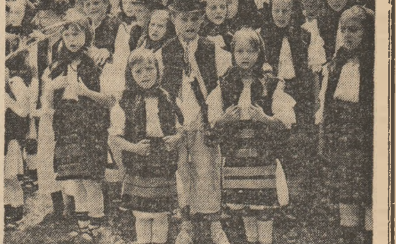
Copii din Botiza la Muzeul Satului și de Artă Populară din Capitală.