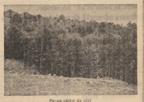
Pe-un plecter de plai