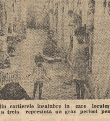
Supraaglomerarea din cartierele insalubre în care locuiește populația săracă din orașele lumii a treia reprezintă un grav pericol pentru sănătatea publică