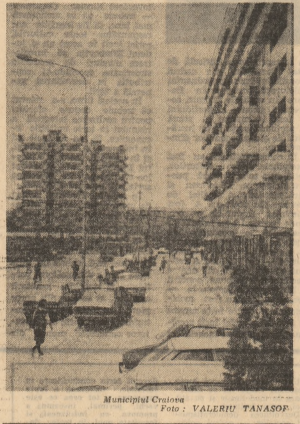
Municipiul Craiova