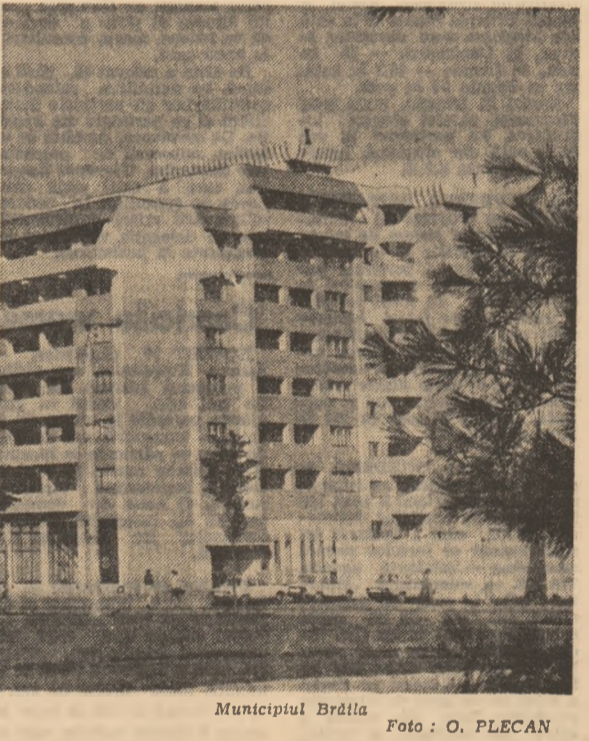
Municipiul Brăila