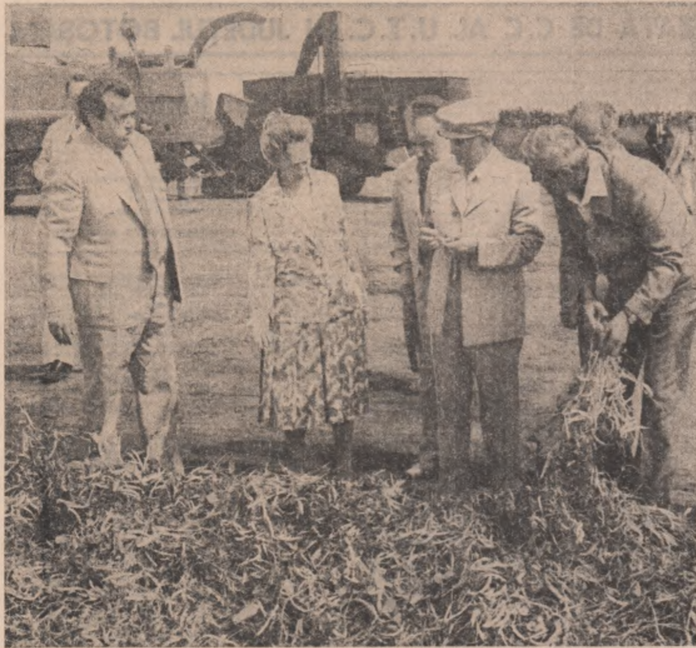
(Urmare din pag. 1)

...marea pavoz, se fac auzite până departe uralele marinarilor alinați la bord pentru a prezenta onorului comandantului suptem. Cu aceste sentimente de dragoste și prețuire au fost în-