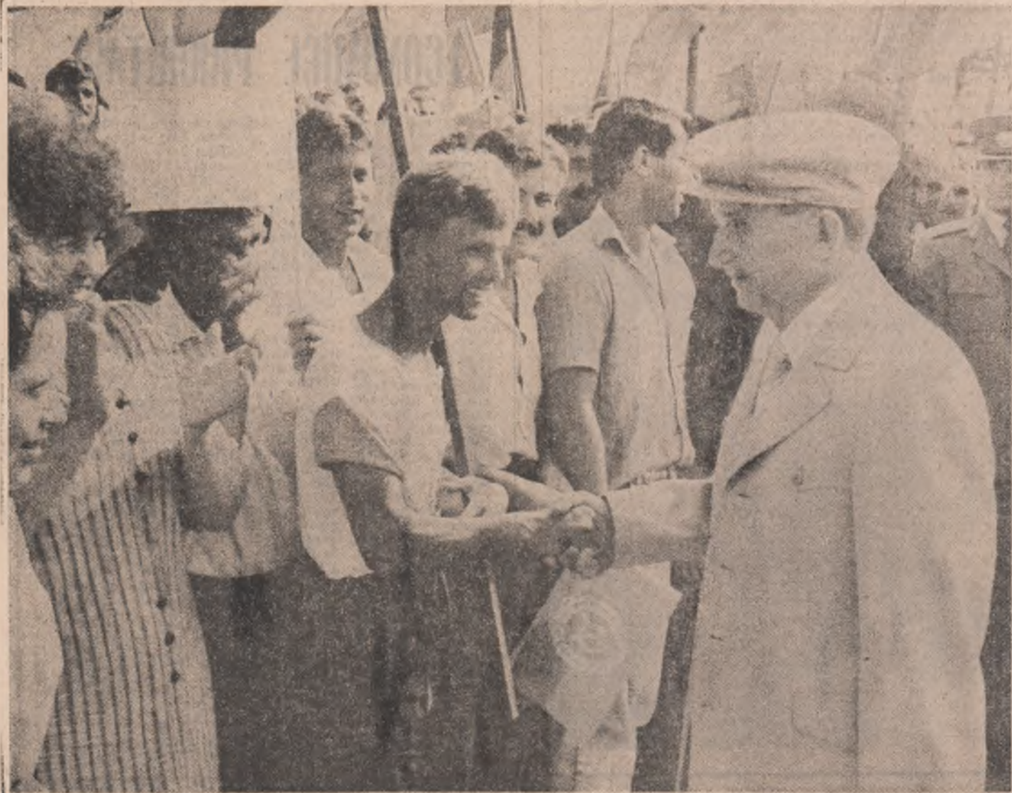
(Continuare în pag. a III-a)