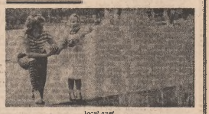
Jocul apoi