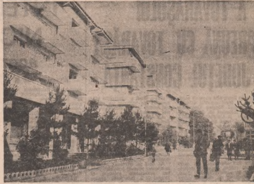
Imagine din Suceava