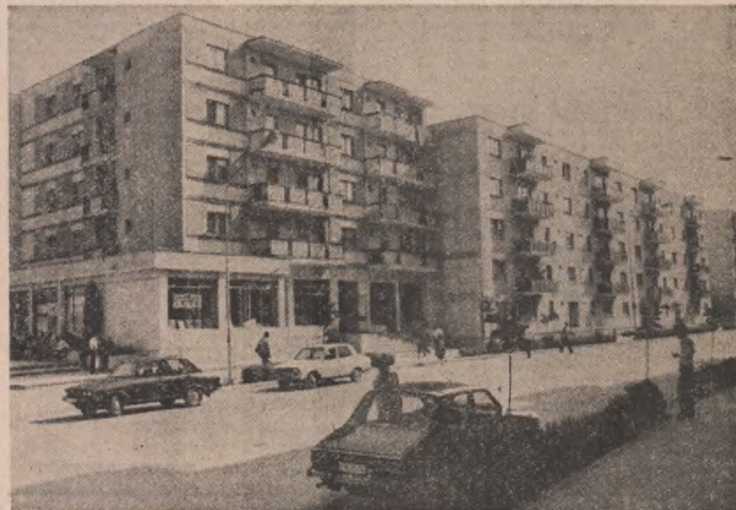
Un nou oraș pe harta țării — Colibași, județul Argeș.