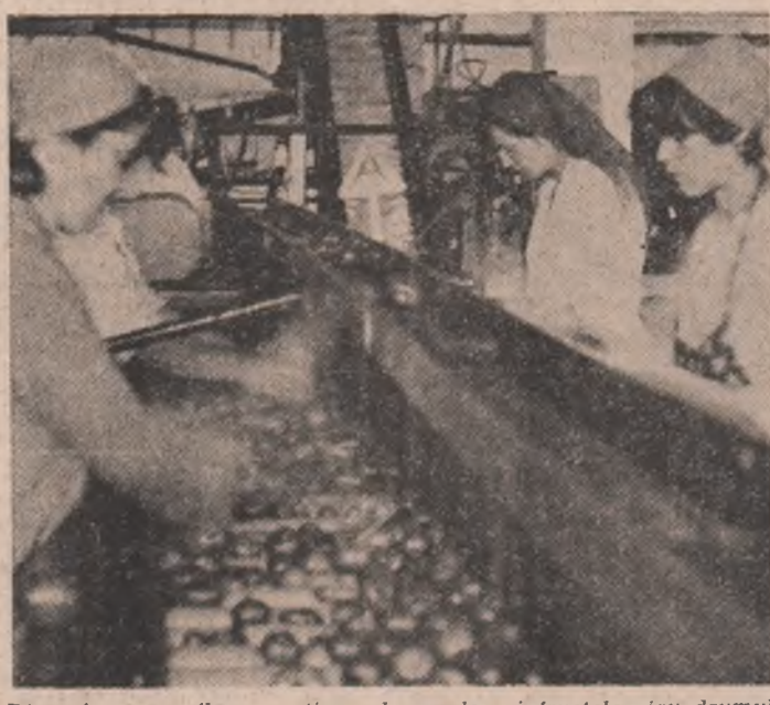
Din cîmp, pe flux continuu, legumele și fructele iau drumul întreprinderilor de prelucrare și industrializare