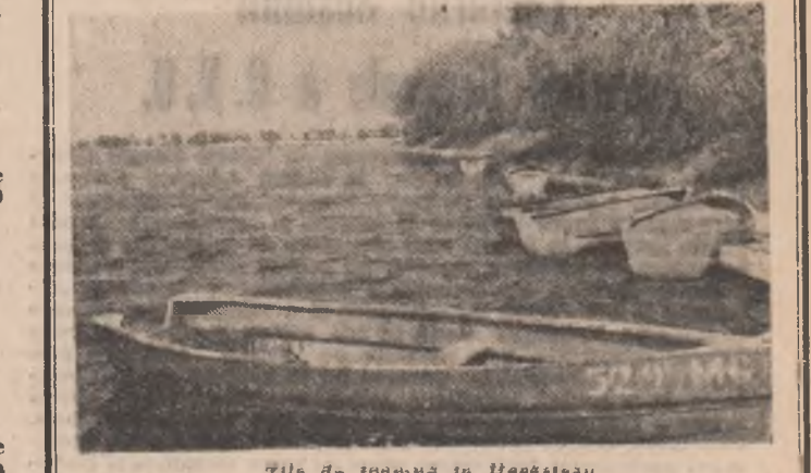
Zile de toamnă în Herăstrău.