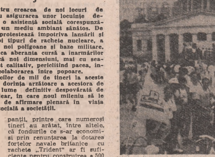
Tineri francezi, înainte de plecarea într-un marș pentru pace și dezarmare