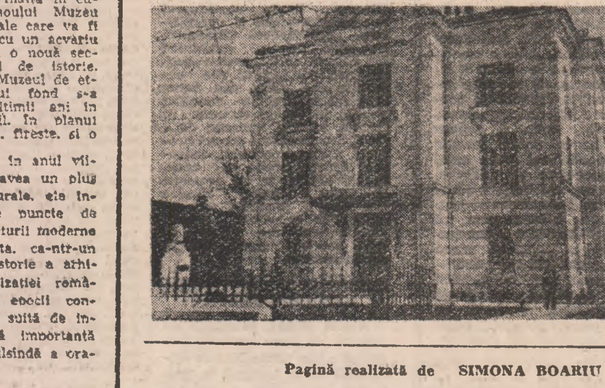
Pagină realizată de SIMONA BOARU