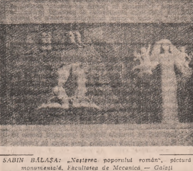
SABINA BALASA: „Nasterea poporului roman”, pictură monumentală, Facultatea de Mecanică - Galati