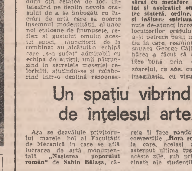
Așa se dezvoltă privitorului marele hol al Facultății de Mecanică în care se află lucrarea de artă monumentală „Nasterea poporului roman” de Sabina Balasa, căreia îi face pîndă nouă sa compoziție „Nora românească” la care, același maeștru, a asternut ultima tușă chiar în aceste zile, sub privirea fascinată ale studenților. Aceste