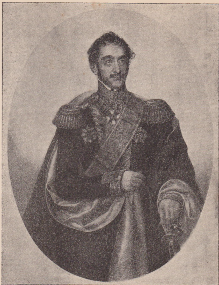
ALEXANDRU DIMITRIE GHICA, Domn al Țării-Românești. — Desemn de J. François Gôse, tipărit la Lemercier, în Paris.