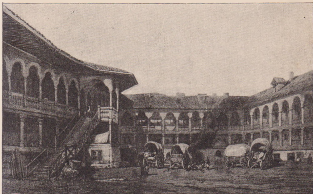
HANUL LUI MANUC DIN BUCUREȘTI (după Bouquet).