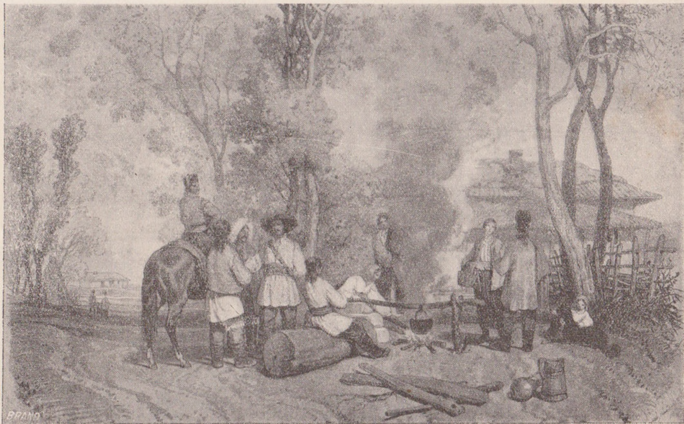
PRIVELIȘTE DE ȚARĂ (după Bocquet).

Supliment la «Sănătătorul», No. 6, anul V.