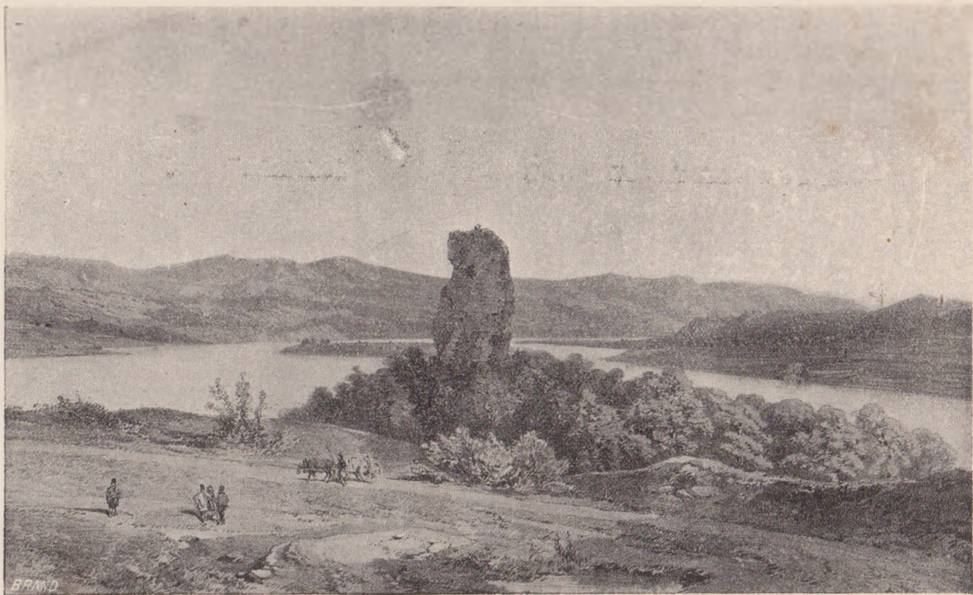
VEDEREA RUINELOR SEVERINULUI VECHIÛ (după Bonquet).

Supliment la «Sămănătorul», No. 6, anul V.