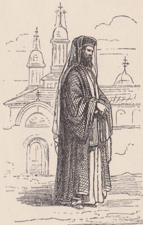
DE LA MĂNĂSTIRE (după Doussault).