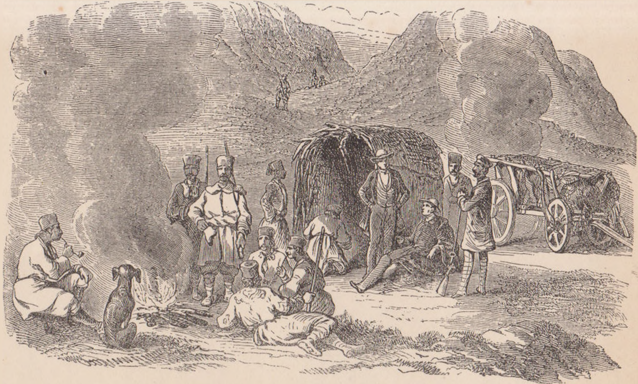
LA VINAT (după Doussault).