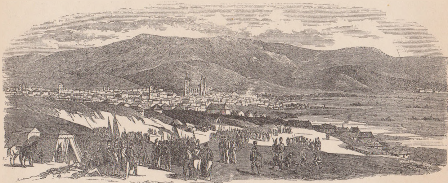
IASII DIN 1830 (după Bouquet).