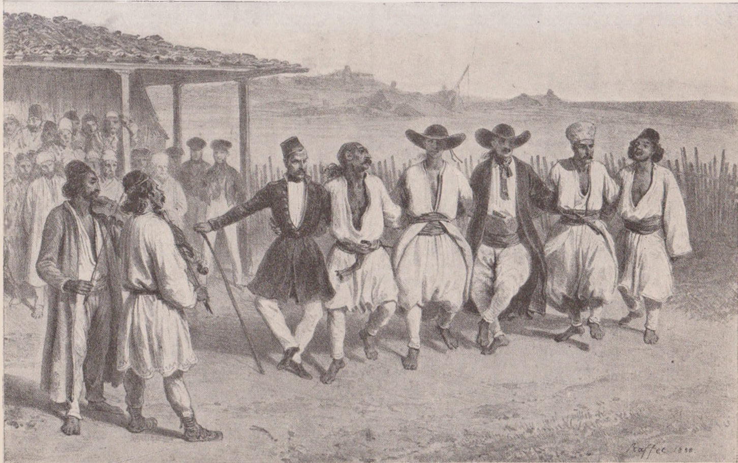
JOCUL LA CERNETI (9 Iulie 1837) (după Raffet).