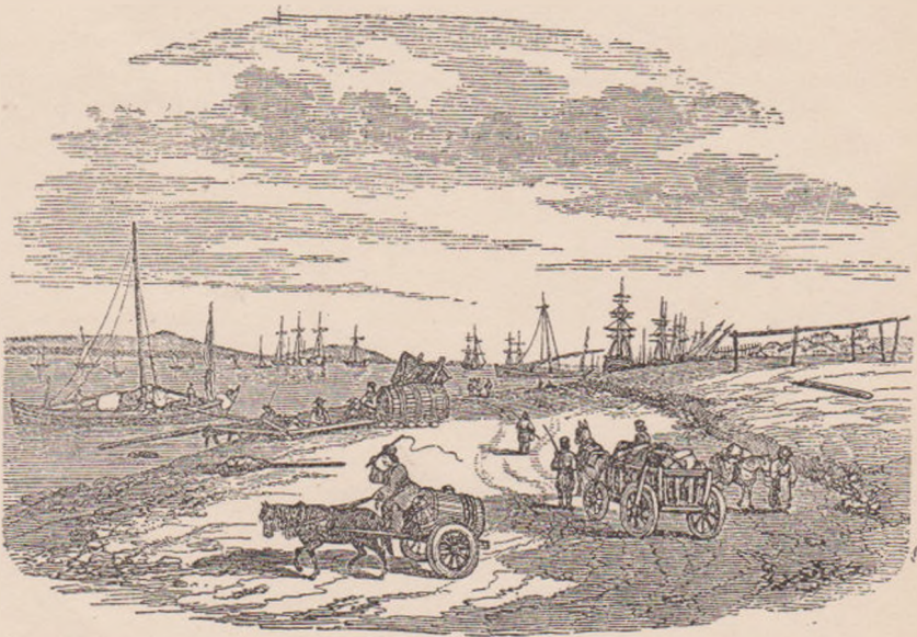
PORTUL BRĂILEI (după Buoquet).