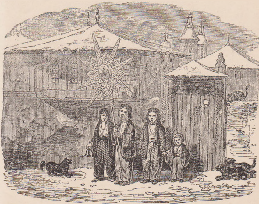
BĂIEȚI CU STEAUA, ÎN BUCUREȘTI (după Doussault).