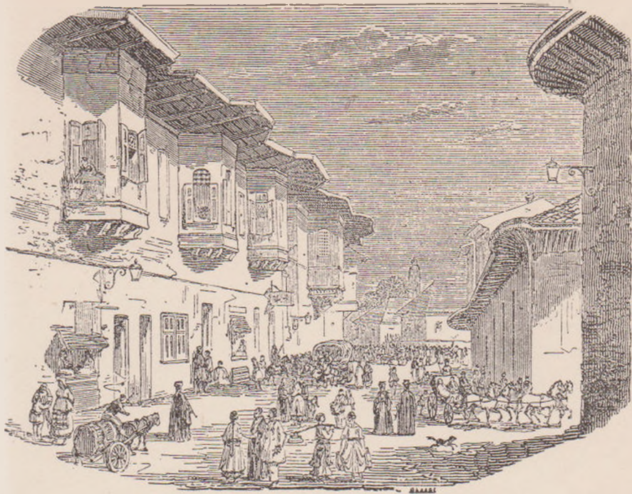
STRADĂ DIN BUCUREȘTI (după Doussault).