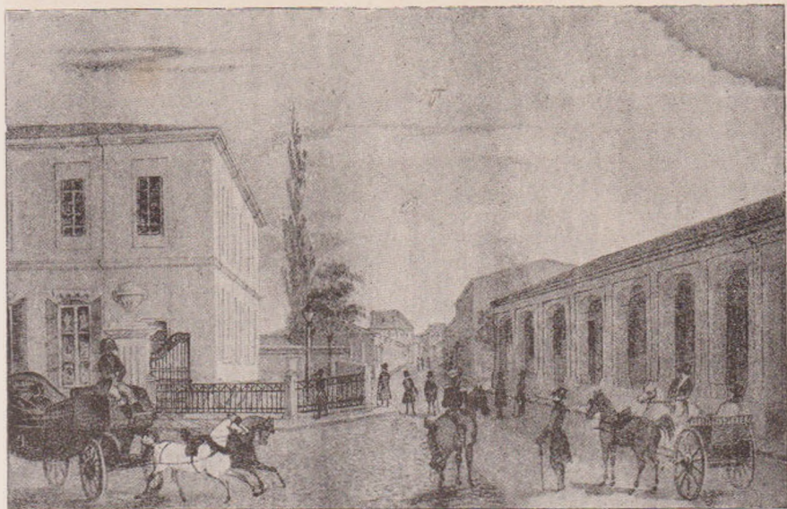
Strada Mare din Iași (din Calendarul pe 1845 al lui M. Kogălniceanu).