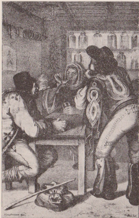
O cîrciumă moldovenească (din același Calendar).

Supliment la «Sfîntulorîta», anul I, No. 24.