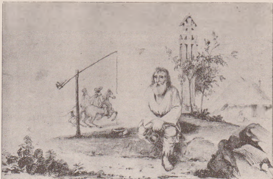
La Cruce (după același Calendar).