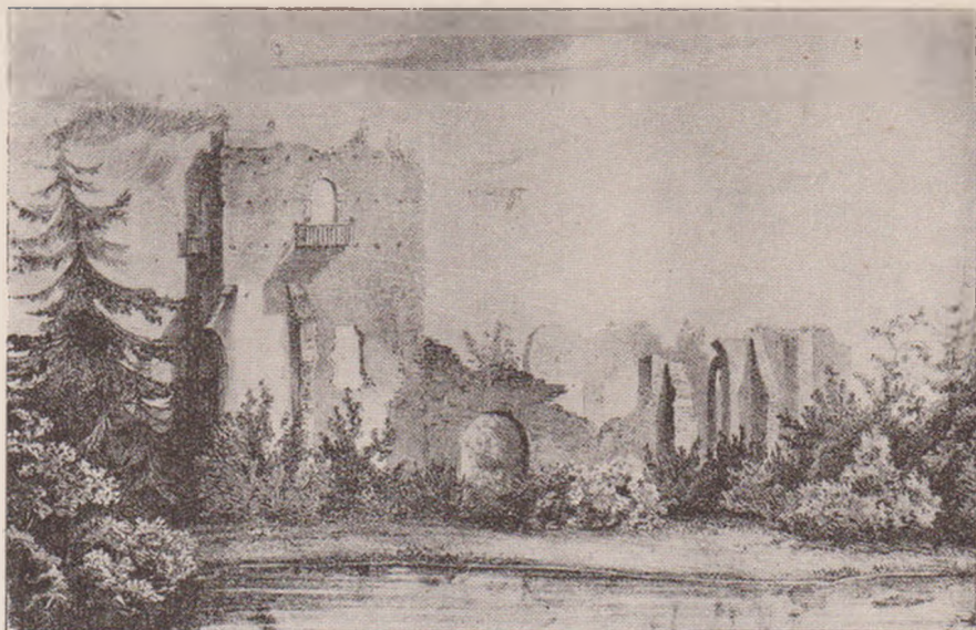
Ruinele bisericii catolice de la Baia, a lui Alexandru-cel-Bun (după Calendarul lui Kogălniceanu pe 1845).