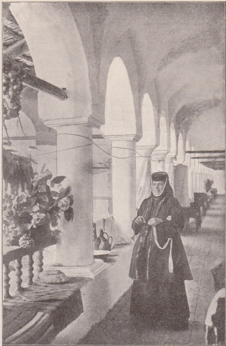
LA HUREZ: DE-A LUNGUL STÎLPILOR.