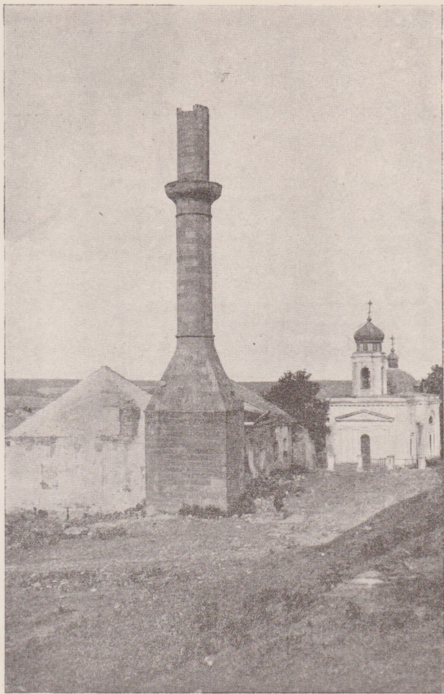
MINARETUL TURCESC DIN CETATEA HOTINULUI ȘI BISERICA CEA NOUĂ A RUȘILOR.