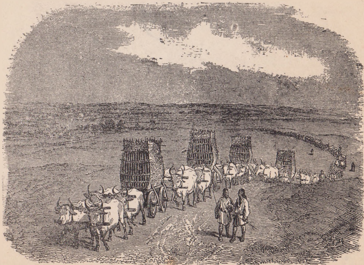
CĂRĂUȘI MOLDOVENI (după Raffet, în călătoria lui Demidoff).