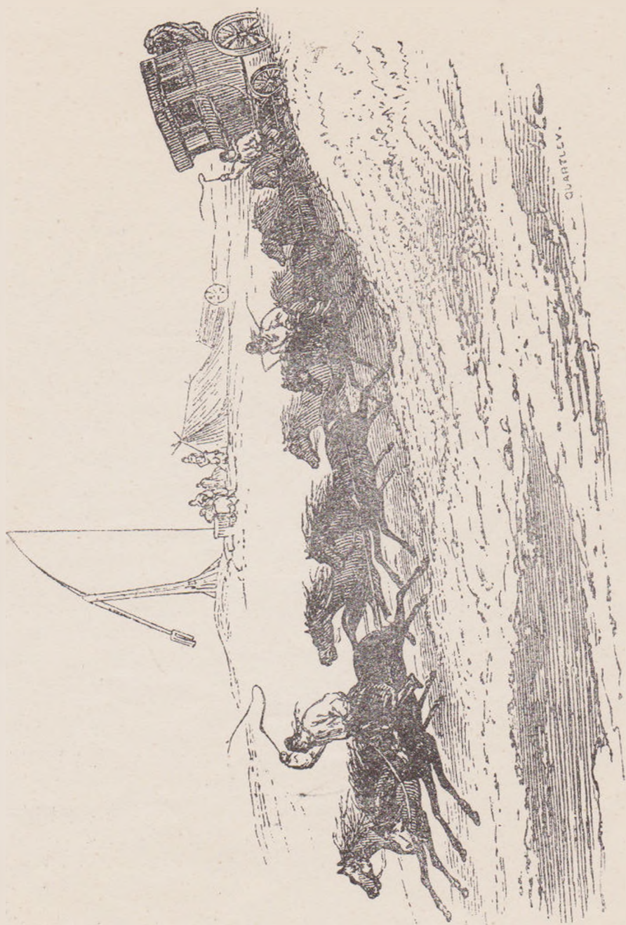
CĂRUȚĂ DE POȘTĂ (după Raffet în călătoria lui Demidoff.)