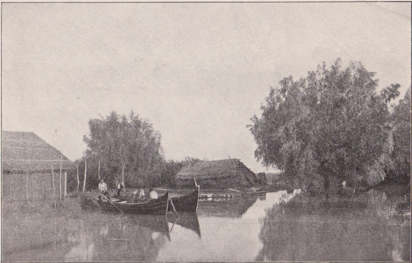
ÎN MARGINEA DUNĂRII: PLECAREA LUNTRAȘILOR (după fotografiile artistice transmise de d-na Farago).