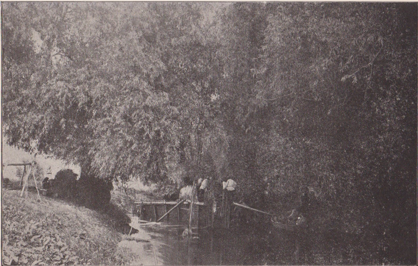
DIN MARGINEA DUNĂRII: SOSIREA LUNTREI.