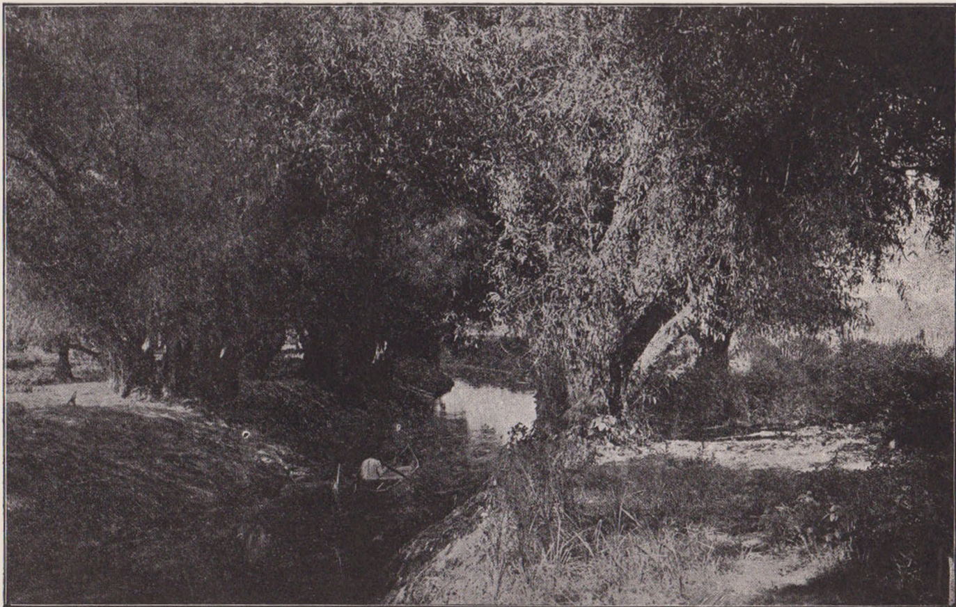
PE MALUL DUNĂRII: UN OCHIŪ DE LUMINĂ PE APĂ (după fotografii artistice de d. Farago).