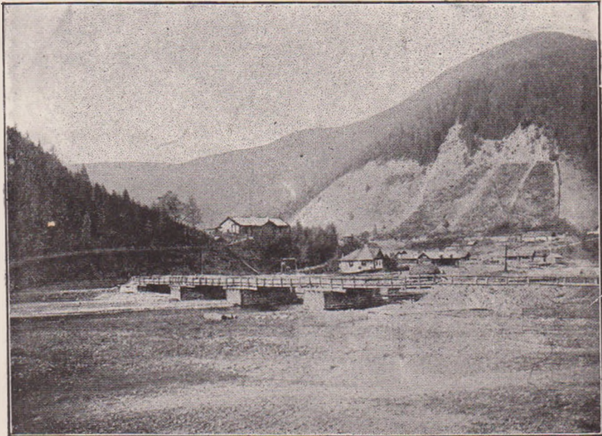
DE PE VALEA BISTRITȚEI

Supliment la «Sămănătorul», anul V, No. 43.