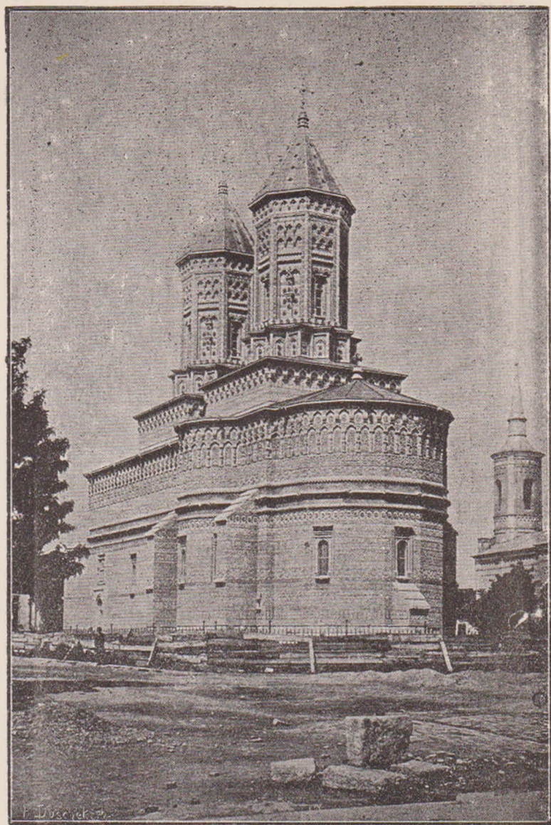
Biserica Țrei Ierarhii din Iași.