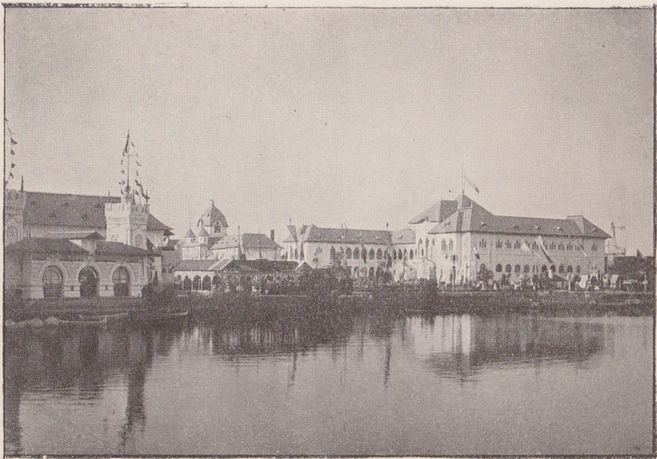
PALATUL REGAL DE LA EXPOZIȚIE: VEDERE PE MARGINEA LACULUI.