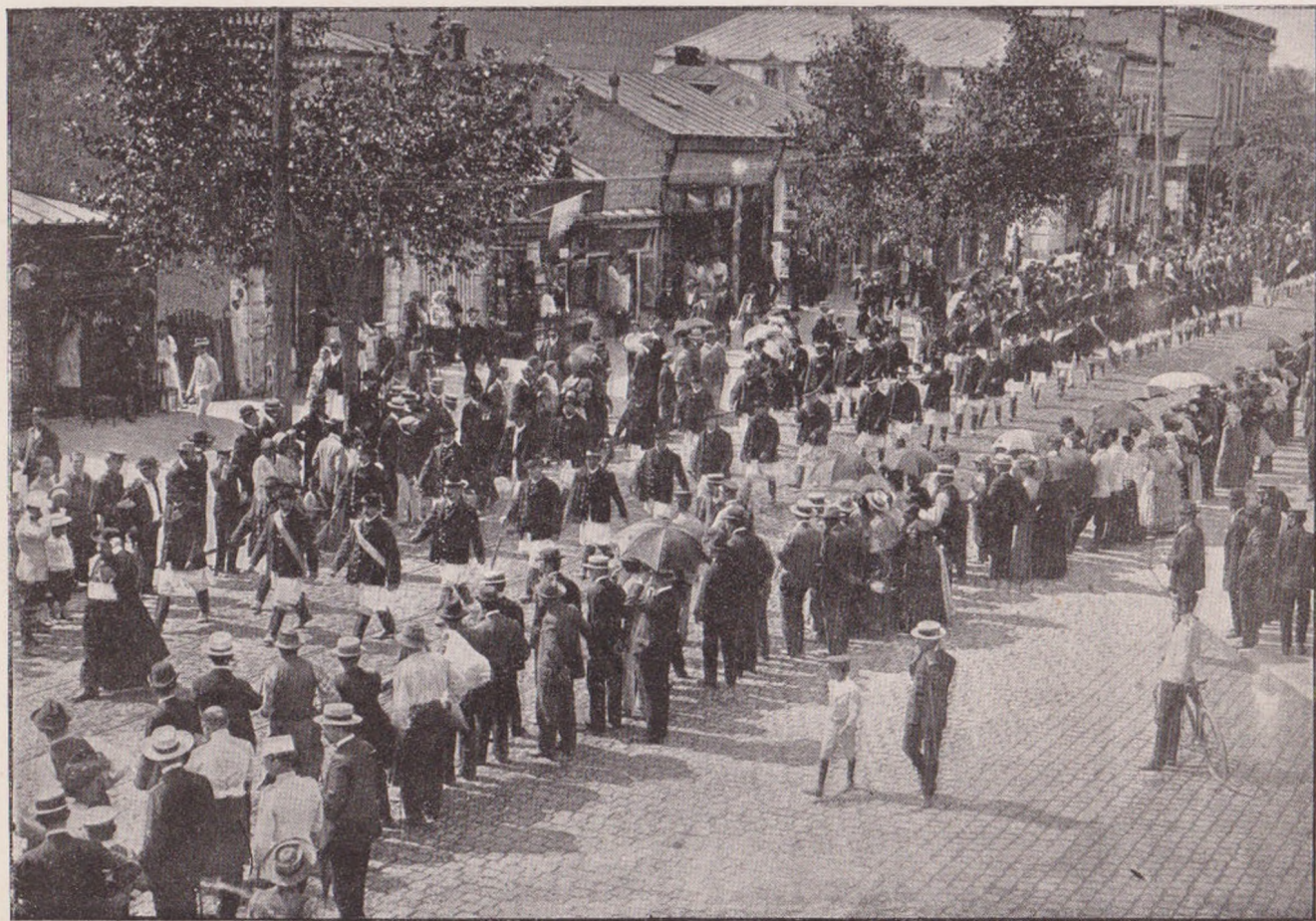
INTRAREA JUNILOR BRAȘOVENI ÎN BUCUREȘTI. I.