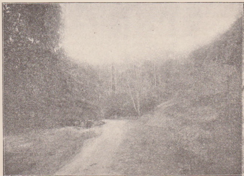
VII. PRIVELIȘTI DE PE VALEA BISTRIȚEI.