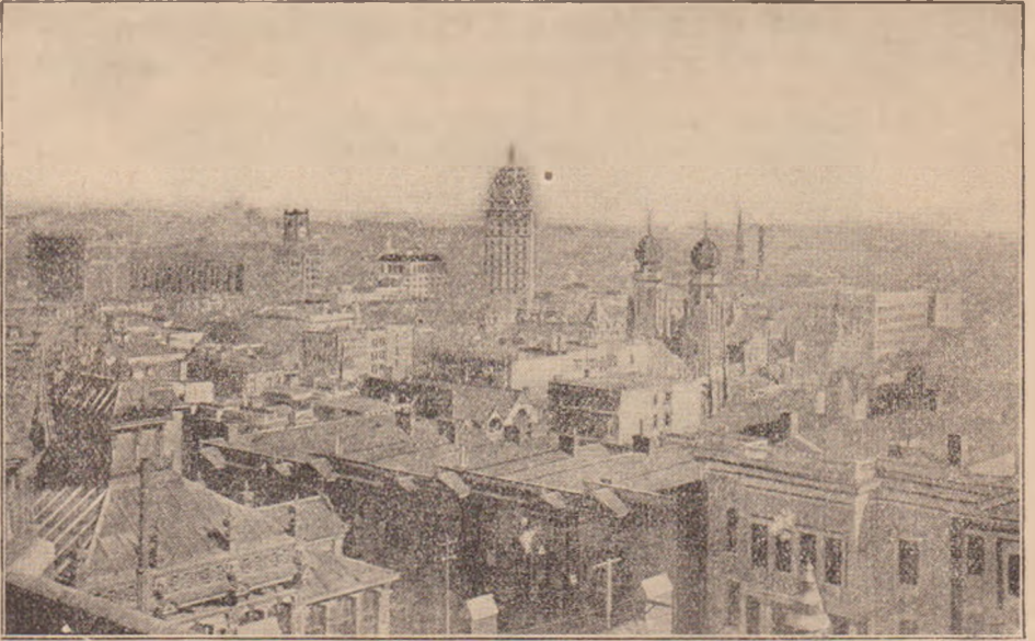
Vederea generală spre NV, N şi NE a oraşului San Francisco (înainte de incendiul şi cutremurul din 1906)

Restul cartierului de jos al oraşului e o îngrămădire de case pline de jos pînă sus numai de prăvălii şi de birouri comerciale. Am reluat în zilele acelea, cît am stat în San Francisco, mai toate aceste străzi în şir, să-mi fixeze bine în minte oameni şi lucruri, să-mi văd cunoştinţele şi să-mi mai cumpăr cîte-ceva. În Emporium am petrecut mult, căci Emporium e un magazin imens, unde găseşti tot ce vrei; ocupă