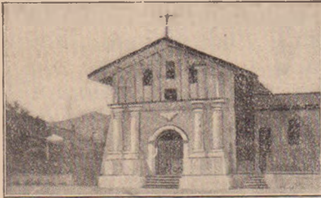
Mistunea Dolores construită de Franciscar. la 1778

tanică : conține într'o parte a lui Facultatea de medicină (restul Universității e la Berkeley, peste Bae); mai are o răspîntie frumoasă, ornată cu un enorm portic, cu coloane frumoase, și alee splendid plantate cu eucaliptus, ciprii și pini roșii gigantici. În această răscruce cîntă muzica în fiecare dimineață. Parcul mai conține încă un Muzău rămas dela expoziția de arte din 1894, ce a avut loc aci în Parc. Între altele mi-aduc aminte c'am mai văzut aci un tron și un pat aurit de al lui Napoleon Bonaparte; am mai văzut o bicicletă făcută pe la 1840 de un ferar din California, o colecție prețioasă de etnografie în care coșurile Pieilor roșii figurau dela mărimea unui cazan pînă