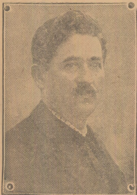
Dr. ION MIHALACHE. Președ. Part. Național Țărănesc.