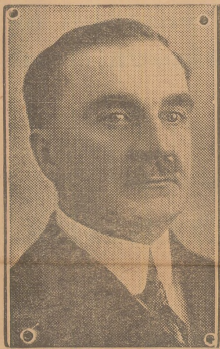
D-I IULIU MANIU

Mai ales în zilele grele trebuie să se manifeste puternic conștiința cetățenească.