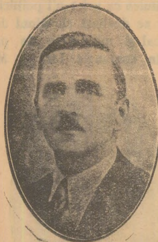
D-l Colonel Vasile Bancescu.

D-l COL. VASILE BANCESCUL, spune și Domnia Sa că partidul național-tărănesc este un partid democratic, cu rădăcini adânci în masa țărănească. — În fața dușmanilor cari pândesc țara, trebuie să fim uniți.