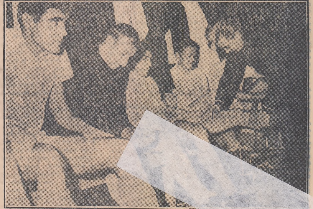
O indiscretă privire... fotografică în viața intimă a guleștenilor: cu etram buge trahis de a teș pe gazon, maserul Oargă face un ultim control de „cal”