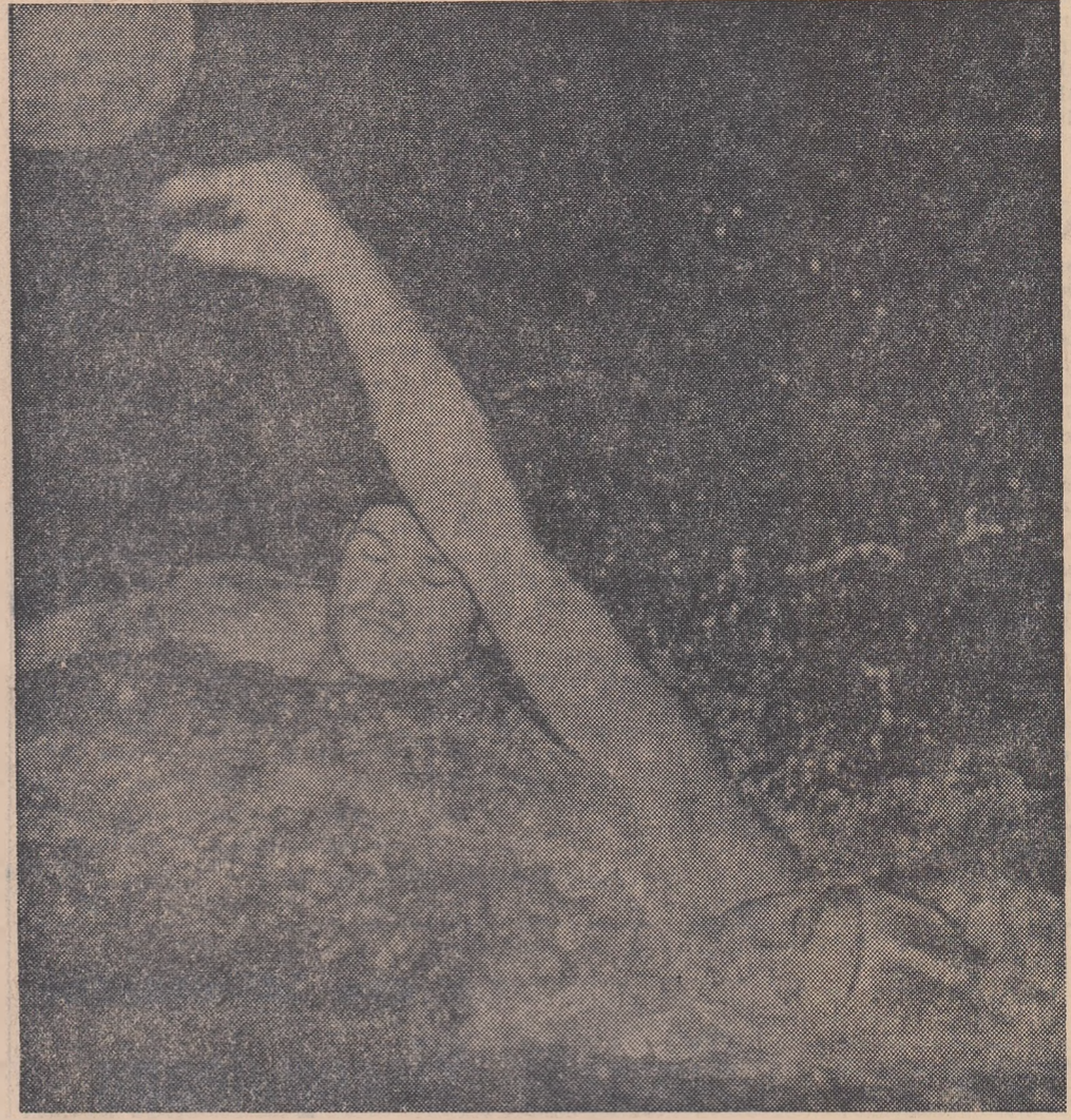
Blajec și Sandici în luptă pentru balon. Fază din jocul Dinamo București - Partizan Belgrad, revenit poloștilor noștri cu 7-6.