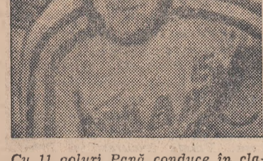
Cu 11 goluri Penă conduce în clasamentul poltereterilor

Nu spunem nici o noutate: de cîtiva ani, boxul craiovean se zbate într-o mediotritare supărătoare.