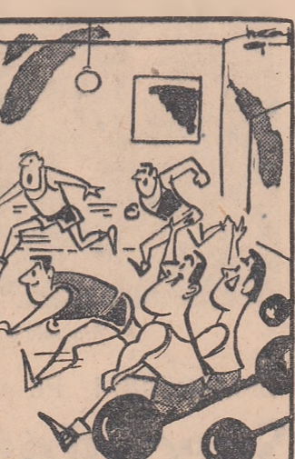
- Hai, ai noștri, halterofili! (Desen de NEAGU RADULESCU)

față „împulsiv” — evaluarea nu se mai poate face complet rezultatele avînd doar o semnificație parțială. Or, în situația în care avem un calendar competițional atât de sărac, cuprinzînd doar 3-4 concursuri de anvergură republicană, nu ne putem permite luxul să mai transformăm unul dintre ele în... experiment.