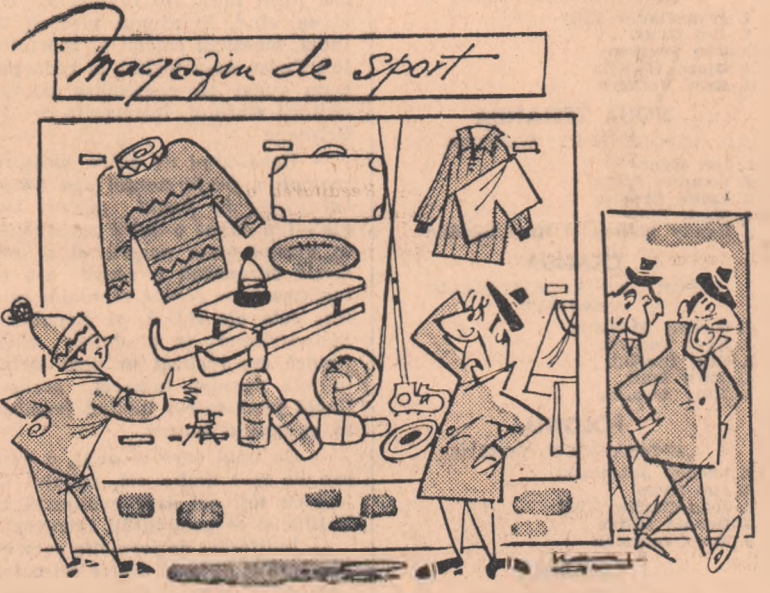
Nene, schiuri faine nu știți unde s-ar găsi? — la vezi, n-or fi adus la „Alimentara”?

No aflăm în plină vizor A REVELIONULI din 31 decembrie, e. e. la care se aplică o nouă formulă tehnică.