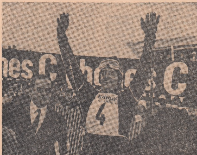
JEAN CLAUDE KILLY