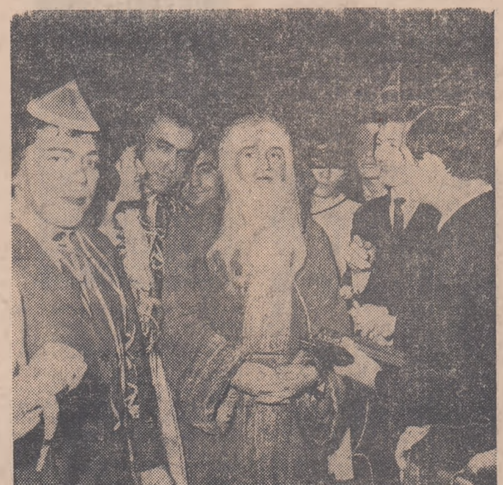
Moș Gerilă dă interviuri