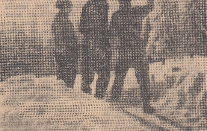
Peisaj de țară...

În țara noastră, în ceea ce privește voleiul masculin, nu există o școală europeană, abandonată jocul nostru specific și face apel la metodele formale bătrînești, depășite, arhicunoscute: 1-2 pase, a trei mingi dincolo de plasă... Alții!