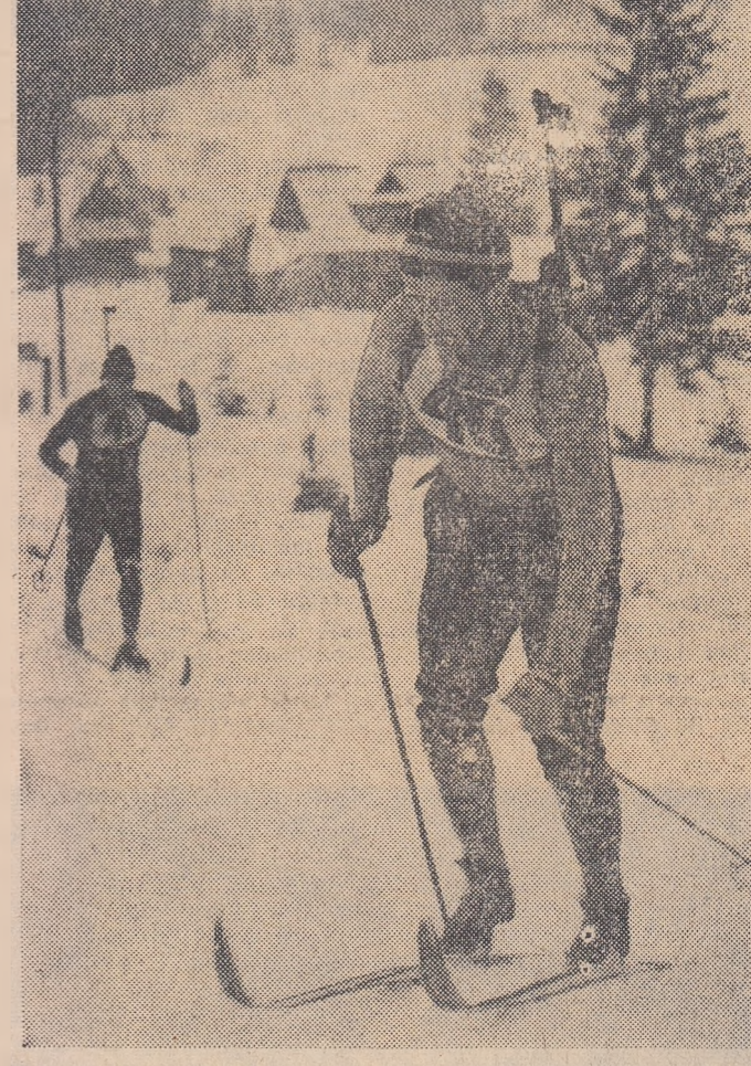
Pe prizile de la Zakopane, biatoniștii polonezi candidați pentru J.O., își continuă cu intensitate pregătirile...