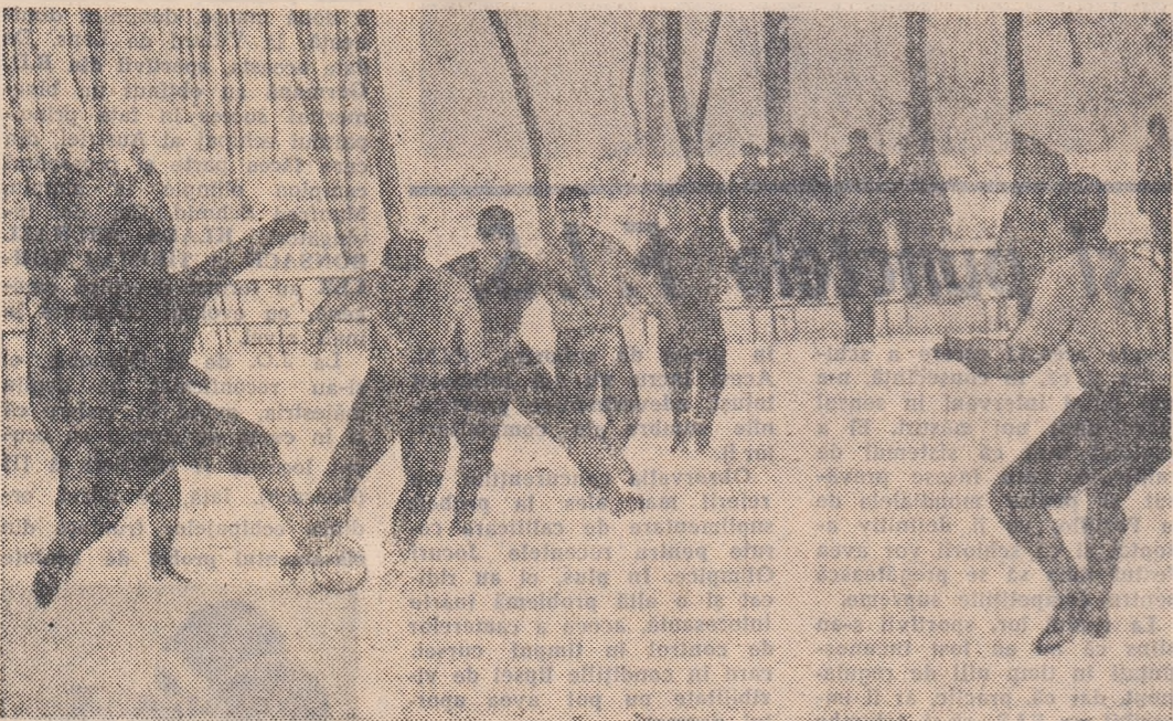
Fază din meciul Dinamo Obor — Dinamo Bacău, încheiat cu o surprinzătoare victorie a oborenilor

Stadionul Dinamo a fost locul de disputare a unui cuplaj fotbalistic la care și-au dat