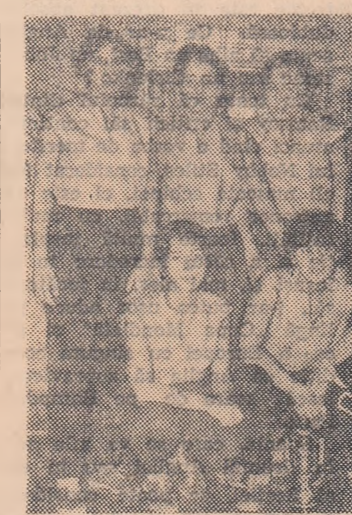
ECOURI LA „HANDBALUL SUB REFLECTOR”