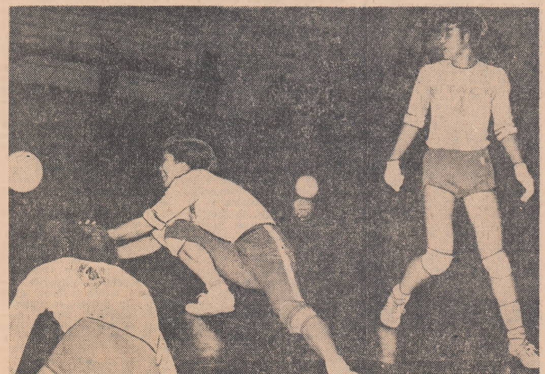
La un antrenament al reprezentativei japoneze — lucru intens pentru pregătirea intervențiilor acrobactice din apărare în linia a doua

Floreasca, timp de aproximativ o oră înaintea confruntărilor naționale Japoniei cu echipa Rapid.