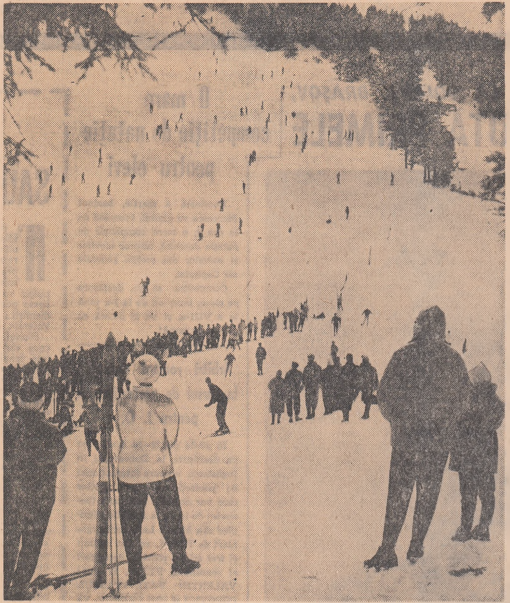
Pirtie de schi, zonă de fericită interferență între sport și turismul de iarnă, poate fi multiplicată în numeroase puncte ale zonei turistice Valea Prahovei. Căitourii noștri aduc numeroase sugestii în acest sens

O amplă serie de propuneri, lapidar formulate, dar o bună cunoaștere a zonei Valea Prahovei, ne trimite tov. București, care precizează că dezideratele sale reprezintă „PUNCTUL DE VEREDERE AL TURISTULUI CARE STRĂBĂTE MUNTII PE JOS“.