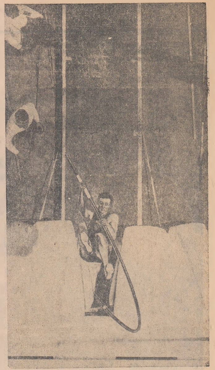
În fracțiunea de secundă următoare, prăjina miraculoasă se va desface ca un arc și Bob Seagren va fi proiectat dincolo de cei 5 m ai stăchetei. Probă atletică sau număr de acrobație?

Cupă (sferturi de finală), activitatea fotbalistică engleză a fost înregistrată simbatic cu citeva partide de campionat Manchester United a învins în deplasare pe Stoke City cu 4-2, instalîndu-se pe primul loc în clasament cu 46 p. dar cu un joc mai mult decât următoarele clasate Leeds United și Manchester City, care au 45 p. Alte rezultate: Sunderland — Nottingham Forest 3-0; Coventry — Wolverhampton 1-0.