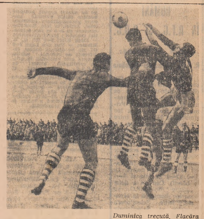
Duminică trecută, Flacăra Moreni a reușit să termine la egalitate, la București, cu Metalul. (Fază din partida Metalul București-Flacăra Moreni din divizia B, seria 1)

Traian Ionescu e lămurit, dar motivează că trebuie să ajungă pînă la vară cum s-a putea. Apoi, intenționează să promoveze masiv, cînd se va termina campionatul de juniori, 7—8 jucători, abia trepuți de 18 ani, din echipa clubului antrenat de Ștefan Stănculescu. În contrast cu înfînirea de la Craiova, unde Universitatea și Dinamo Bacău au aliniat în formații