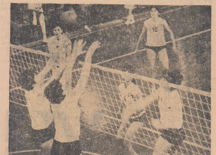
Blocajul dinamovistelor n-a rezistat atacului tipografeilor

În sala Dinamo s-a disputat ieri partida restanță din campionatul diviziei A de volei feminin între Dinamo și C.P.B. După un joc anost, presărat cu numeroase greșeli, victoria a revenit dinamovistelor cu 3-0