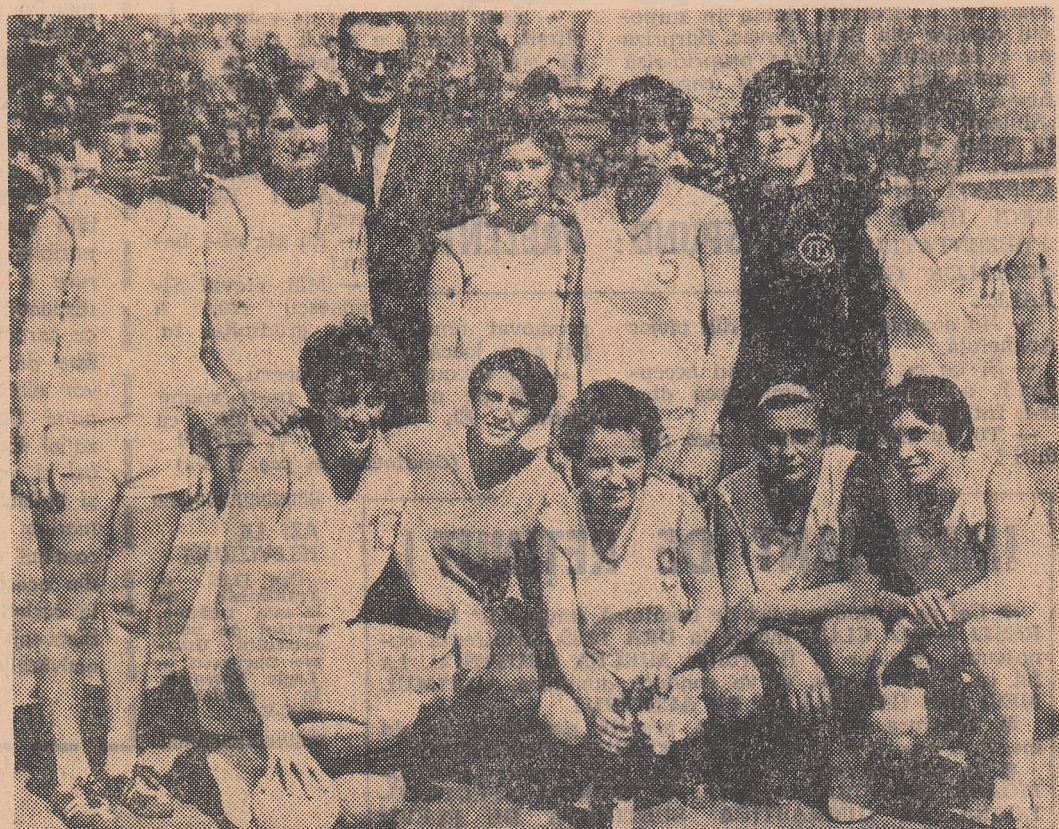
lată pe handbalistele din Buhuș după un joc disputat pe teren propriu