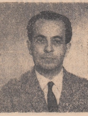
Medicina sportivă a reușit să-și contureze parametrii ce-l sînt necesari pentru controlul și dirijarea antrenamentului sportivului de performanță; rezultatele acestor investigații pe sportivii încep azi să fie utilizate cu succes și în scopul ameliorării suferințelor omului bolnav. Constatarea efectului favorabil pe care-l are efortul fizic asupra organismului a dus la ideea utilizării sale (cu intensități progresiv crescînde), ca metodă de grăbire a convalescenței la bolnavii de inimă. Școala medicală suedeză recomandă antrenamente pe bicicletă, sub riguroso control medical, pentru ameliorarea bolnavilor suferinți de angină pectorală.

Aportul pe care-l poate da medicina în domeniul dirijării sportivului de performanță, se bazează pe concluziile medicilor care cercetă de specialitate efectuate pe plan mondial în ultimii 20 de ani, cit și pe datele obținute de celelalte ramuri ale medicinei profilactice și curative. Într-o medicină sportivă și cea curativă există o continuitate colaterală, descoperirile obținute într-un domeniu fiind asimilate și aplicate în celălalt ramuri, contribuindu-se astfel, la progresul general al științei medicale. Alpinismul sau zborul la mare altitudine, scufundările în adîncurile mării, ca să luăm numai cîteva exemple mai frapante, nu ar fi fost posibile fără o cunoaștere amănunțită a fiziologiei efortului în condițiile specifice de activitate și hiperbarism. Cercetările în aceste domenii au început avînd la bază cunoștințele și metodele fiziologiei clasice, dezvoltate și completate pe parcurs, parțial, cu constatări obținute. Rezultatele finale ale acestor investigații au permis realizarea performanțelor cunoscute, dar în plus, ele au putut fi folosite și în medicina clasică, ca bază de pornire cu aplicabilitate practică în dezvoltarea unor tehnici noi în anesteziologie, sau a unor metode noi de tratament cu oxigen sub presiune înaltă.