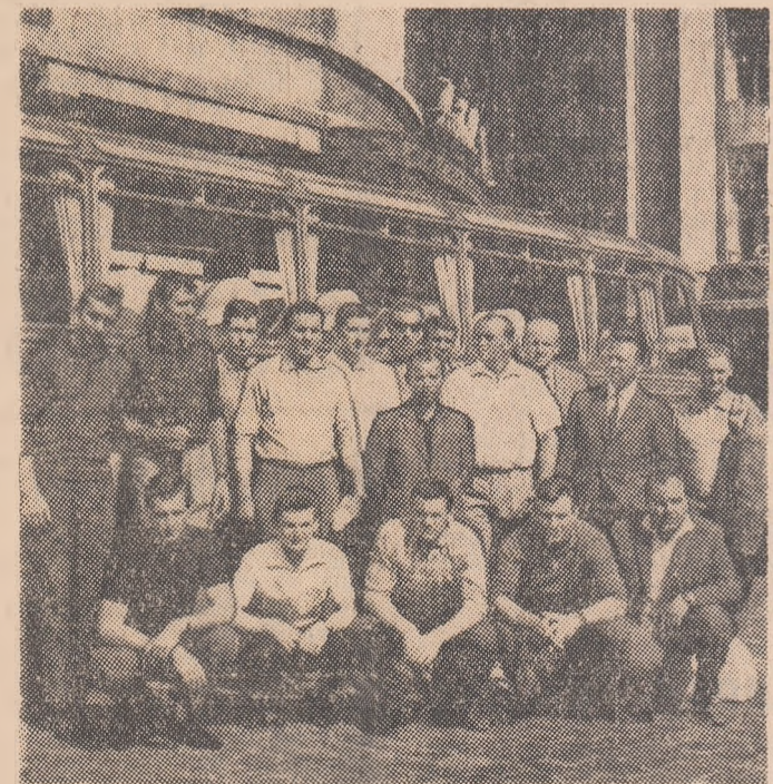
Delegația sportivilor cehoslovaci la sosirea în Capitală