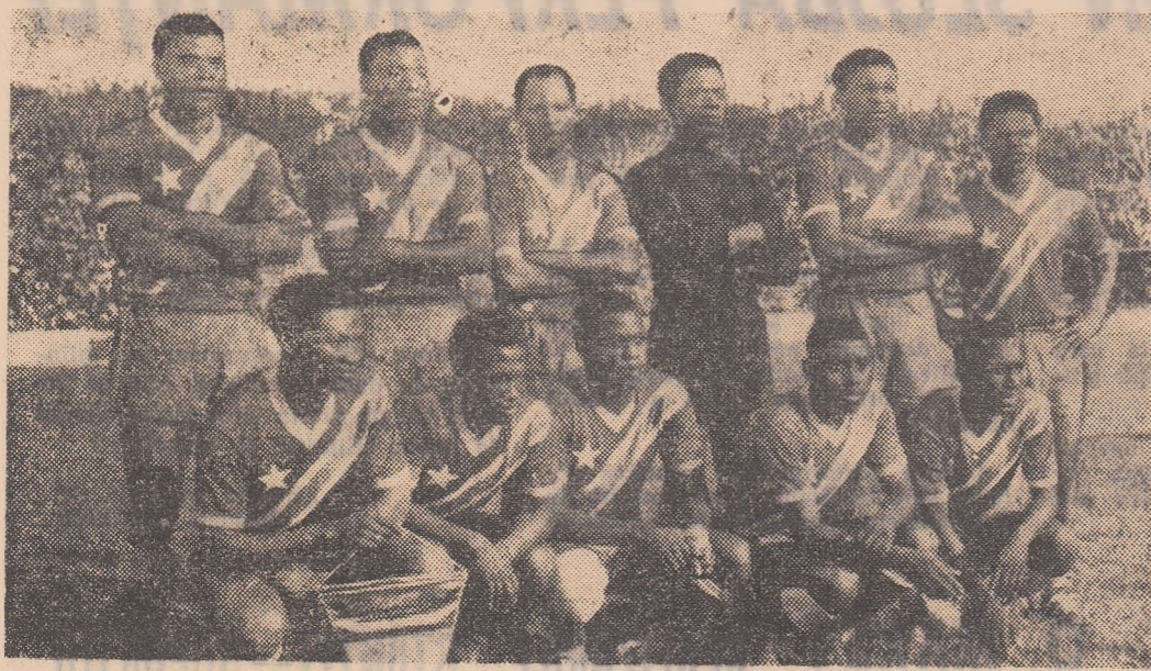
Campionii Africii — reprezentativa Congo (Kinshasa) sosește la București

Turneul în țara noastră al campioaneli Congoul și a Africii, „Leopardii” din Kinshasa, ne prilejuiește câteva considerații pe marginea fotbalului african, pe care vi le încredințăm și dumneavoastră, stimați cititori. După cum s-a anunțat, pentru prima oară în istoria fotbalului, unul din cele 16 locuri în întreținerea finală a C.M. va reveni automat unei reprezentante africane, câștigătoare a grupului A. XIV-a. Așadar, hotărârea Comitetului F.I.F.A. de curs unei mai vechi aspirații a „soccerului” african, dornic de a avea o mesagerie directă la marea finală. Se pune, însă, întrebarea dacă acest drept, reprezentat de dreptate sau numai o favoare acordată unor