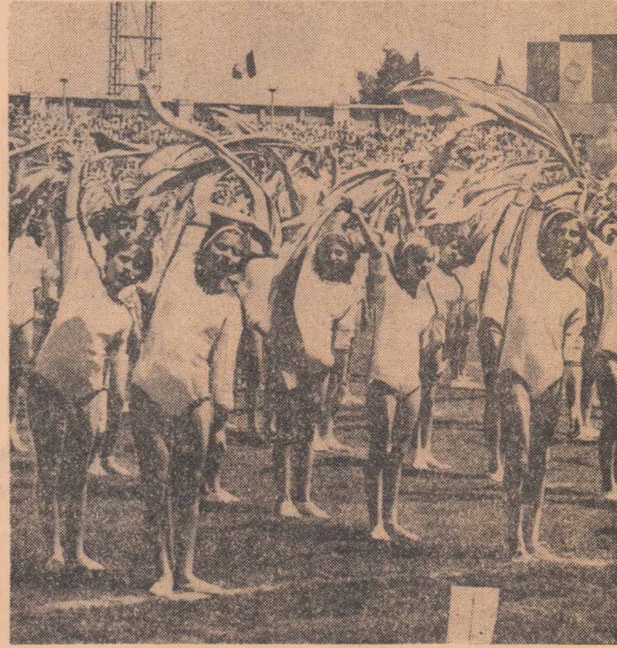
Reprizele de gimnastică au încântat publicul spectator. Pe gazon, evoluează pionieretele din sectorul II