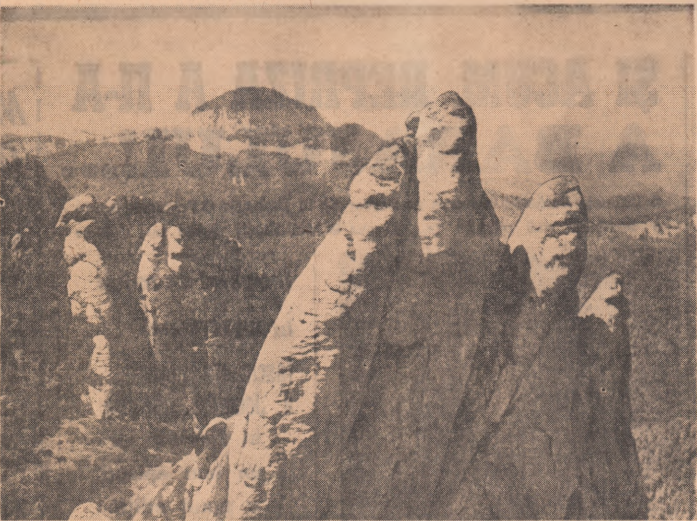
Colții „MINA DRACULUI”