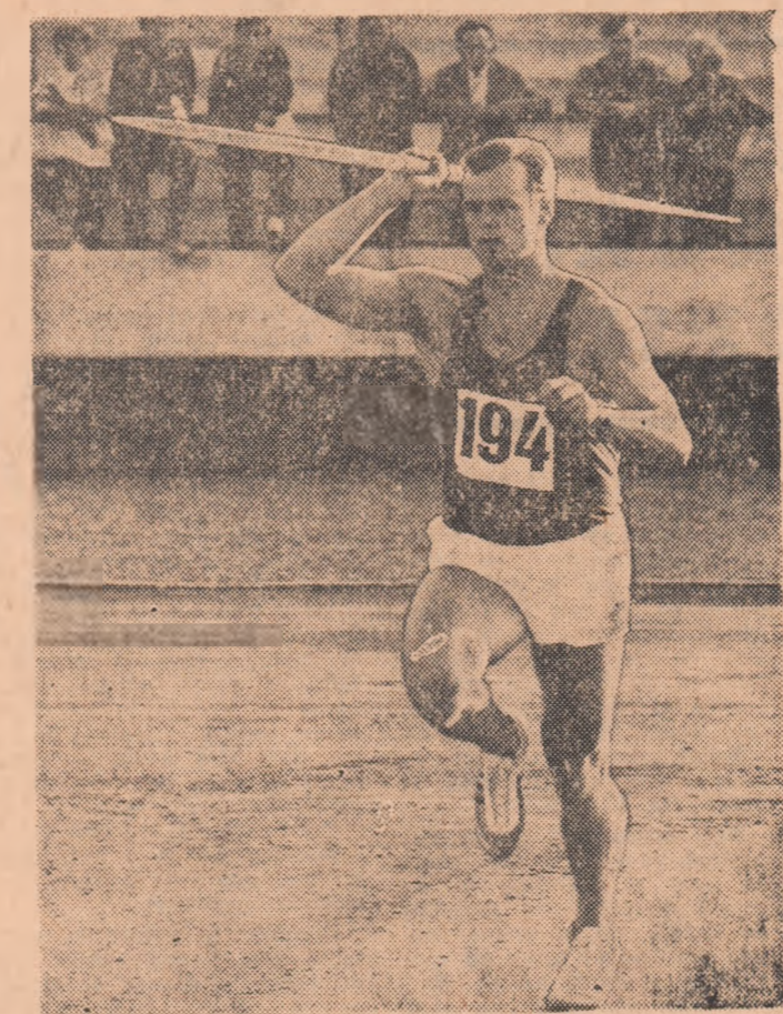
JANIS LUSIS Cu acest ultim rezultat el a întrecut cu 26 cm recordul mondial din 1964 al capriciosului norvegian Terje Pedersen, impunîndu-se ca favoritul nr. 1 pentru apropiatele J.O. din Mexic.

De-a lungul anilor Janis Lusiș s-a dovedit un aruncător puternic, constant la performanțe superioare și dacă polonezul Sidlo deține „recordul” aruncărilor peste 80 de metri, în orice caz el îi are pe cel al rezultatelor de peste... 90 de metri (91,98 m 23.6.1968; 90,98 m 7.9.1967; 90,92 m 20.6.1968). Lusiș are 29 de ani (s-a născut la 19 mai 1939 la Elgava în R.S.S. Estonă), este înalț de 182 cm și cîntărește 84 kg. Este profesor de educație fizică la Riga. Din 1959 rezultatele sale au evoluat astfel: 1959 — 72,63 m (al 77-lea din lume), 1960 — 74,89 m (55), 1961 — 81,01 m (9), 1962 — 86,04 m (1), 1963 — 83,05 (4), 1964 — 82,59 m (8), 1965 — 86,56 m (2), 1966 — 85,70 m (2), 1967 — 90,98 m (1), 1968 — 91,98 m (1).