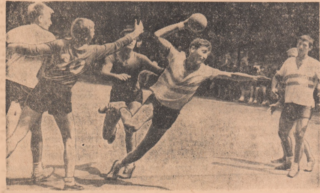
Apărarea semicercă a fost străpunsă... Incă un gol pentru mureșeni. Fază din meciul M.I.U. Tg. Mureș — „Ceramica” Jimbolia

pioana. La handbal, turneul final a ales cele mai bune 4 echipe din cele 18 participante: „Chimia” Oraș Gh. Gheorghiu-Dej, Gr. șc. energ. Craiova, M.I.U. Tg. Mureș și „Ceramica” Jimbolia, care au și susținut primele meciuri. Chimia a învins detașat (29-19) formația craioveană, în timp ce mureșenii au obținut victoria pe muce de cuțit (19-18) în fața elevilor din Jimbolia. La volei, s-au calificat în turneul final Chimia Copșa Mică, 23 August Buc., Agricola Sibiu și Centrocop Int. Vilcea. Primele rezultate: Chimia-23 August 3-0, Centrocop-Agricola 3-1.